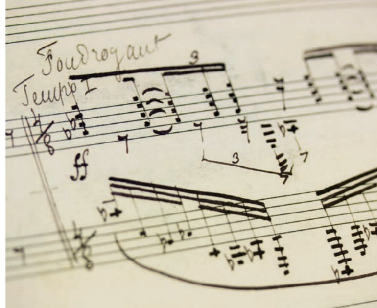
Alexander Scriabin, Piano Sonata no. 7

Das Autograph von Schuberts Es-dur-Trio op. 100 wurde im Laufe seiner Entstehung grundlegend verändert. Das teils stark überarbeitete Manuskript legt davon beredtes Zeugnis ab.